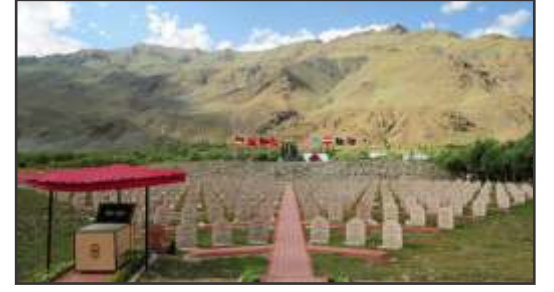
ಕಾರ್ಗಲ್ ಯುದ್ಧದಲ್ಲಿ ದೇಶದ ರಕ್ಷಣೆಗಾಗಿ ಹೋರಾಡಿ ಹುತಾತ್ಮರಾದ ವೀರಯೋಧರ ನೆನಪಿನಲ್ಲಿ ಜಮ್ಮು ಕಾಶ್ಮೀರದ ಡ್ರಾಸ್‌ನಲ್ಲಿ ನಿರ್ಮಿಸಲಾದ ಯುದ್ಧ ಸ್ಮಾರಕದ ಒಂದು ಚಿತ್ರ. ಈ ಯುದ್ಧದಲ್ಲಿ ಅಕ್ರಮಣಕಾರರನ್ನು ಹೊರದಬ್ಬಿದ ಭಾರತೀಯ ಸೇನೆಯ ವೀರ ಸೈನಿಕರ ಪೌರ್ಮಿ ಸಾಹಸ ಮತ್ತು ಬಲಿದಾನದ ನೆನಪಿನಲ್ಲಿ ಪ್ರತಿವರ್ಷ ಜುಲೈ 26 ರಂದು "ಕಾರ್ಗಲ್ ವಿಜಯ ದಿವಸ"ವನ್ನು ಆಚರಿಸಲಾಗುತ್ತದೆ.