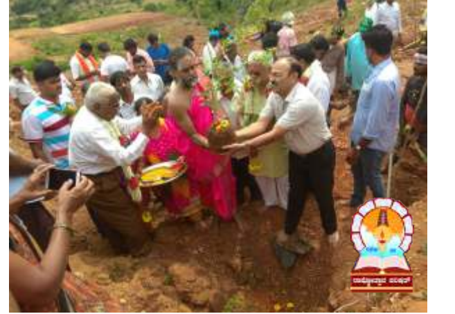
ಉಣಿಸುವ ಪ್ರಕ್ರಿಯೆ, ಮಳೆನೀರನ್ನು ಹಿಡಿದಿಡುವ ಕ್ರಮ, ಮರಗಳ ಪೋಷಣೆ ಬಗ್ಗೆ ಮಾರ್ಗದರ್ಶನ ಮಾಡುತ್ತಿದ್ದಾರೆ.