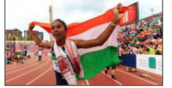
ಇತ್ತೀಚೆಗೆ ಫಿನ್‌ಲ್ಯಾಂಡಿನಲ್ಲಿ ನಡೆದ ವಿಶ್ವ ಕಿರಿಯರ ಅಥ್ಲೆಟಿಕ್ಸ್ ಪಂದ್ಯಾಟದಲ್ಲಿ ಚಿನ್ನದ ಪದಕ ಗೆದ್ದ ಮೊದಲ ಭಾರತೀಯ ಓಟಗಾರ್ತಿ ಹಿಮಾ ದಾಸ್.